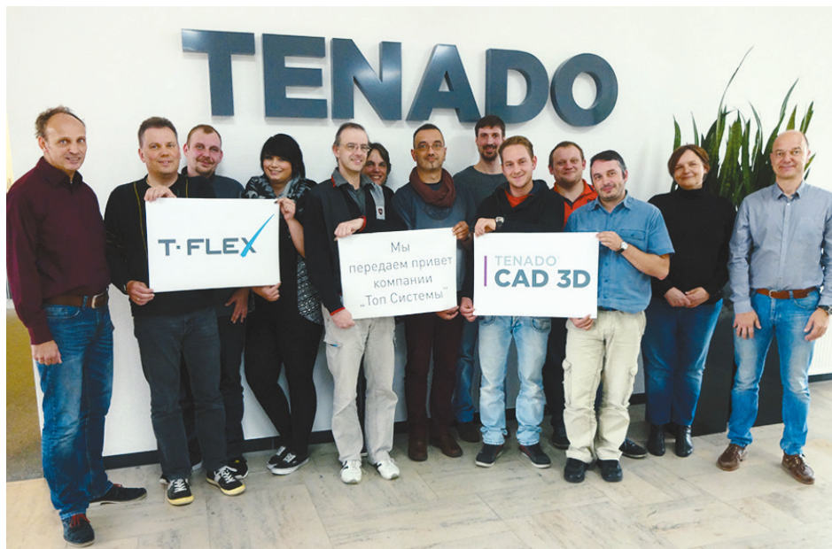
Команда TENADO объявила о сотрудничестве с компанией «Топ Системы»

На деле ситуация выглядит следующим образом. Российская компания «Топ Системы», известный производитель программного обеспечения под торговой маркой T-FLEX, и немецкая компания TENADO, уже около 30 лет специализирующаяся на разработке и внедрении систем САПР в области строительства, архитектуры, машиностроения и ландшафтного дизайна, заключили соглашение о распространении российского программного комплекса T-FLEX в Германии. И не только в Германии — условия договора распространяются также на Австрию и Швейцарию. Вдумайтесь! В условиях, когда недавние политические деятели ратуют за расширение санкций и пугают Россию запретом на