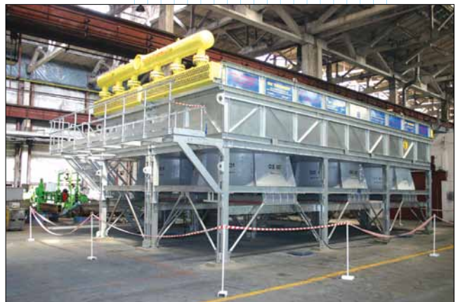
Аппарат воздушного охлаждения “Айсберг”

Открытое сотрудничество руководителей подразделений ОАО “Борхиммаш”, участвующих в проекте автоматизации, помогло в изучении процесса разработки и согласования конструкторско-технологической документации (КТД). За год настройки системы бюро САПР научилось использовать встроенный API на высоком уровне, смогло задействовать даже такой функционал системы, как перехват событий и графическое отображение данных.