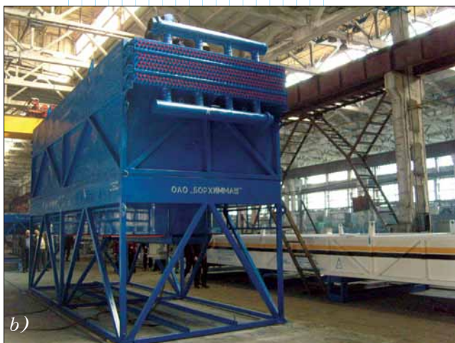
Аппараты воздушного охлаждения блочно-модульные типа: а – АВГ-БМ-83; б – АВГ-БМ-135