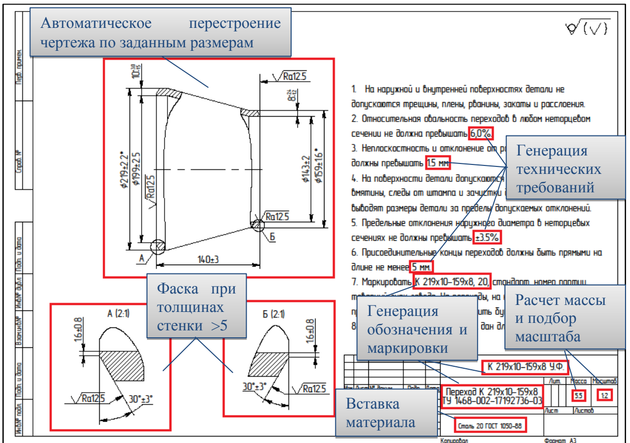
Рис. 3. Примеры автоматически получаемых чертежей элементов трубопроводов