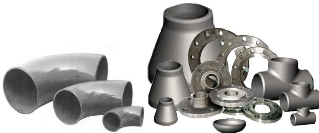
Рис. 1. Соединительные элементы трубопроводов

На первом этапе процесса автоматизации необходимы системы T-FLEX CAD 2D (конструкторская часть), T-FLEX Технология (технологическая подготовка производства), T-FLEX DOCs (хранение конструкторско-технологической документации, отчетная система). В дальнейшем найдет применение механизм выдачи заданий, разработка бизнес-процессов, планирование производства и т.д. Функционал систем можно наращивать по мере решения текущих задач и появления новых, в том числе с охватом остальных служб предприятия (ПДО, бухгалтерия, склад, производство, снабжение, канцелярия). Эти функции обеспечивают системы T-FLEX Техническое Нормирование (трудовое и материальное), T-FLEX ЧПУ, системы Оперативно-календарного планирования, CRM-системы для обработки заказов и ведения договоров и многое другое.